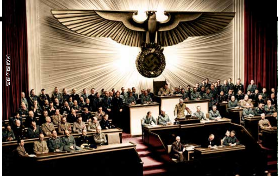
הארכיון הפדרלי הגרמני