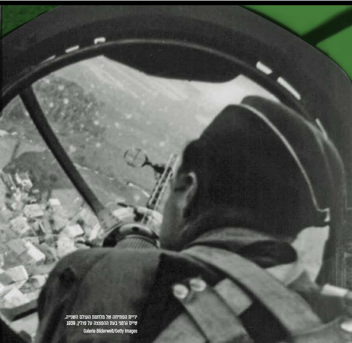
יריית הפתיחה של מלחמת העולם השנייה. שייס גרמני בעת ההפצצה על פולין, 1939